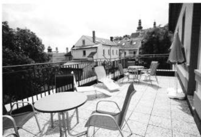
terasa u spečenake místnosti