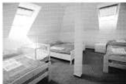
nové pokoje v půdních prostorách