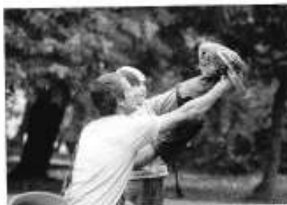
Doprovodný program v zámeckém parku ve Smečně