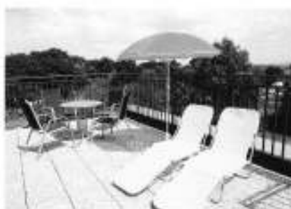
terasa u společenské místnosti