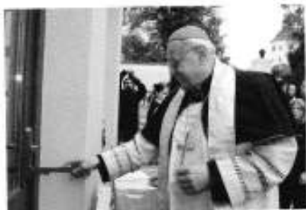
Symbolické znovuotevření po rekonstrukci