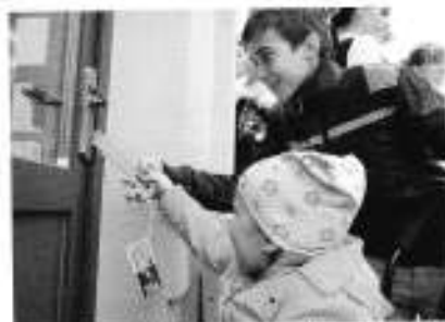
Symbolické osvěcení Rodinného centra Smečno zdravotně postiženým