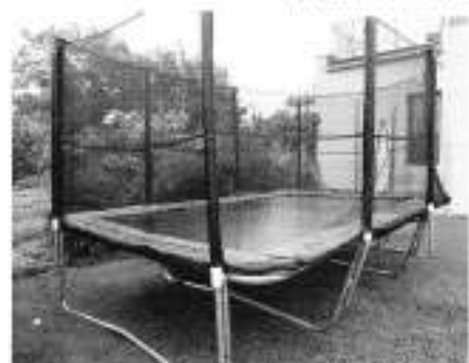
nové trampolíny na zahradě