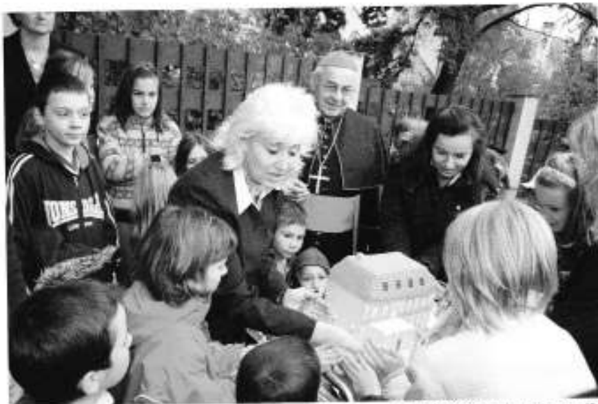
Martinské Rodinné centrum pro děti