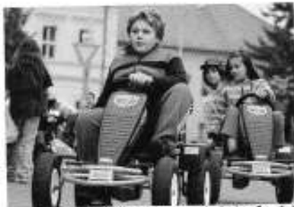
Doprovodný program na náměstí ve Smečně