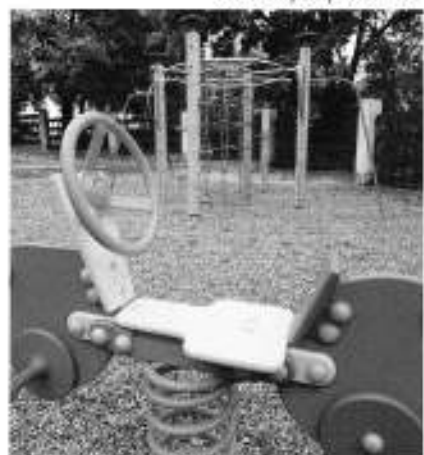
hřiště pro děti