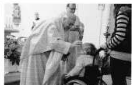
Slavnostní bohoslužba v místním kostele