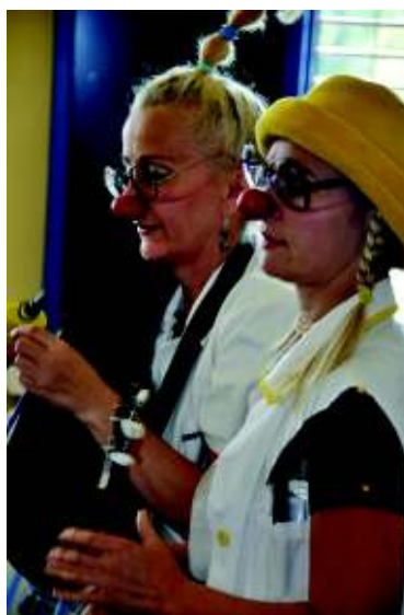
V průběhu konference byl připraven psycho-relaxační a terapeutický program, který zahrnoval vystoupení Zdravotních klaunů